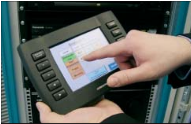
Touchdisplay für die Crestron- Medien- steuerung.