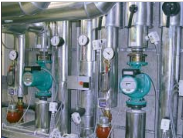
Dezentrale Gebäudeautomation sind Umwälzpumpen mit LON-Works-Schnittstelle erforderlich.

Die angewandte Integrationsplanung, die gewerkebergreifenden Arbeiten der ausführenden Firmen und Systemintegratoren, die Bauüberwachung und Koordination über moderne internetgestützte Projektmanagement-Software waren die Garanten für eine erfolgreiche Umsetzung des Projektes. Gerade hier wurde die Notwendigkeit einer qualifizierten beruflichen Weiterbildung deutlich. Ohne technisches Know-how und gut ausgebildetes Fachpersonal lassen sich solche Projek-