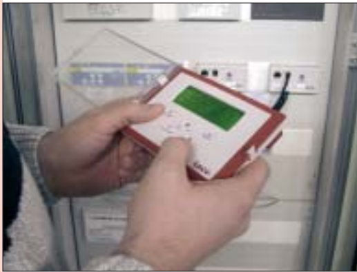
Gebäudeautomation mit LON-Works.