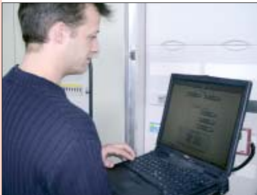
Parametrierung der Gebäudeautomation mit Hilfe eines Laptops.

Die Wärme wird über eine Niedertemperatur-Fußbodenheizung in den Raum eingebracht. An besonders heißen Tagen mit hohen Außentemperaturen kann diese Fußbodenheizung auch zur Kühlung eingesetzt werden. Die Kälte für den Serverraum und die Fußbodenkühlung des Neubaus wird mittels zwei zweistufigen Kompressionskältemaschinen erzeugt. Eine Kältemaschine arbeitet dabei auf einen Eisspeicher, der bei Nacht mit Niedertarif-Strom geladen wird.